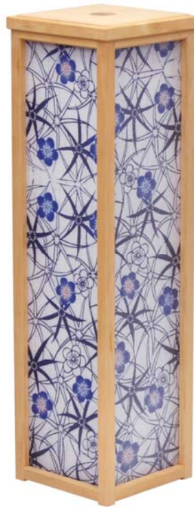
富士乃灯 - 特大