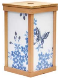
富士乃灯 - 大