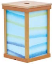
富士乃灯 - 小